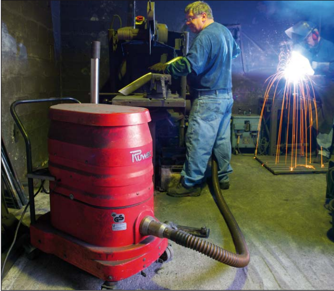
WS 2210 dans l'usinage des métaux