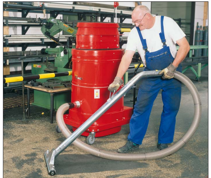
WS 3320, nettoyage du sol, dans l'industrie des métaux