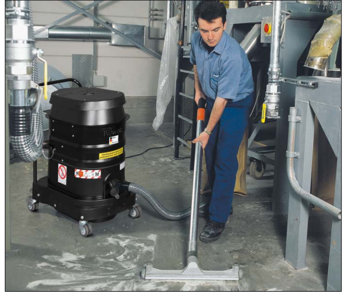
WS 2220, zone 22, dans l'industrie chimique