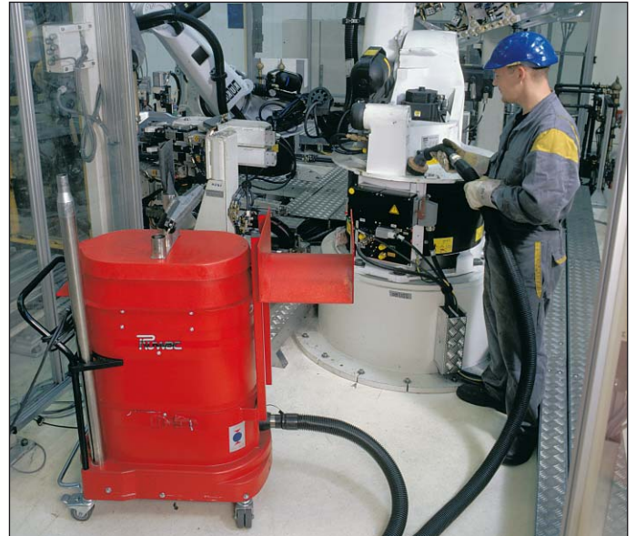
WS 2210 pour le nettoyage de machines