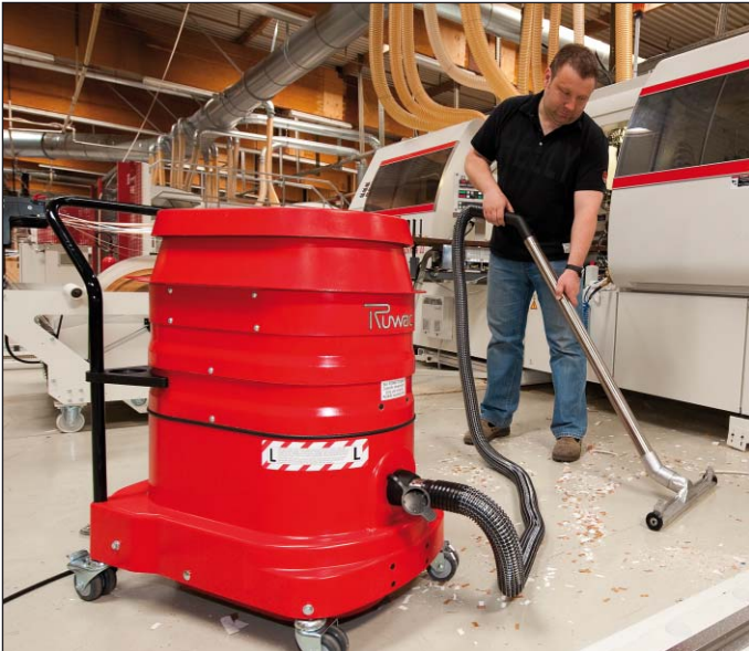
WSZ 2320 pour le nettoyage du sol