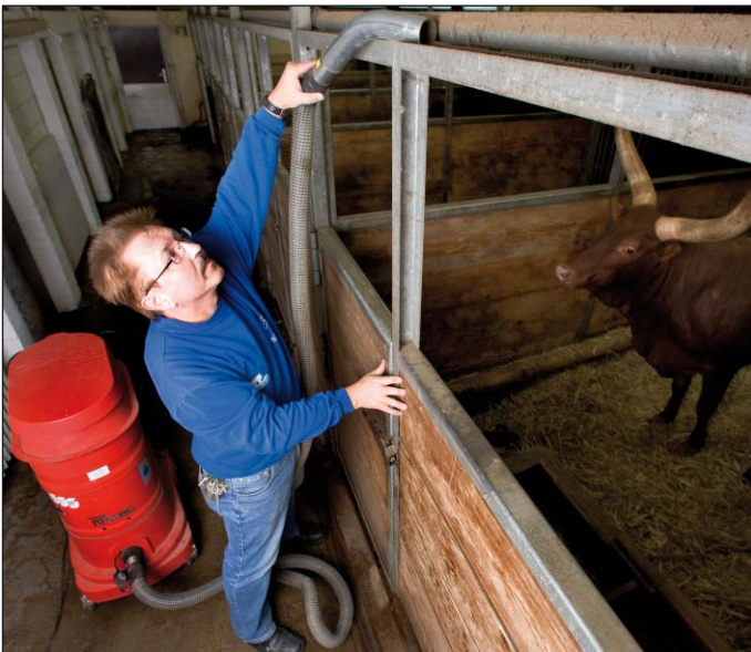
WS 2310, aspiration d'objets dans les zoos