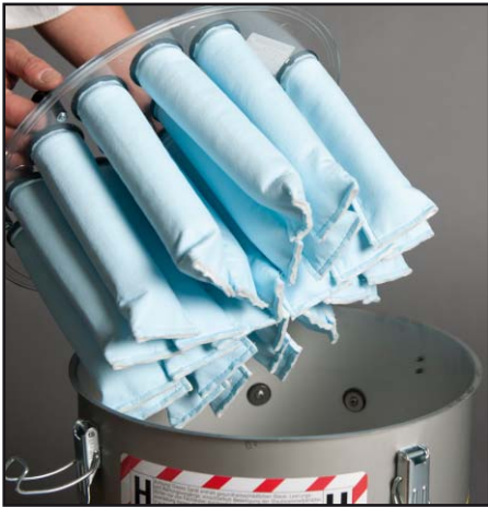
Filter principal (filtre à canal)

Petit aspirateur industriel, homologué pour les poussières fines et les poussières dangereuses pour la santé. Il est homologué pour la classe de poussière H et a l'homologation poussière de bois H2, suivant laquelle l'aspirateur remplit les exigences réglementaires les plus strictes établies pour les aspirateurs industriels pour l'industrie et le bâtiment. Cet appareil est adapté à toutes les tâches d'aspiration de poussières fines, dangereuses pour la santé ou cancérigènes, par exemple les poussières de ciment ou de ponçage.