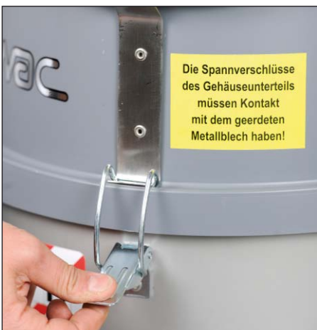
Sécurité grâce aux fermetures à genouillère

Die Spannverschlüsse des Gehäuseunterteils müssen Kontakt mit dem geerdeten Metallblech haben!