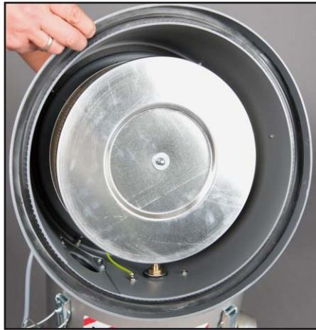
Filtres à poussière résiduelle de classe de poussière H