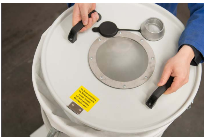
Remplacement du filtre simple par levage du couvercle