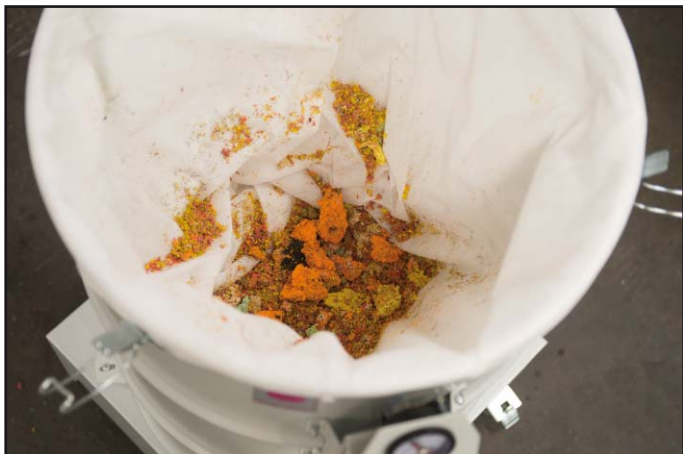
Collecte des résidus de coupe dans un sac en non tissé

Les aspirateurs industriels de la série DAV-SB sont utilisés sur des installations de production pour l'aspiration de peluches et résidus de découpe (papier, plastique, tissu). Leur puissance d'aspiration, leur construction et leurs dimensions sont adaptées aux exigences des machines de production sur lesquelles ils sont utilisés. Les résidus de coupe sont aspirés et collectés dans un sac à filtre de classe de poussière M. Les matériaux aspirés se déposent de façon compacte de façon à exploiter au maximum le volume du filtre. Le filtre plein se retire facilement de l'aspirateur.