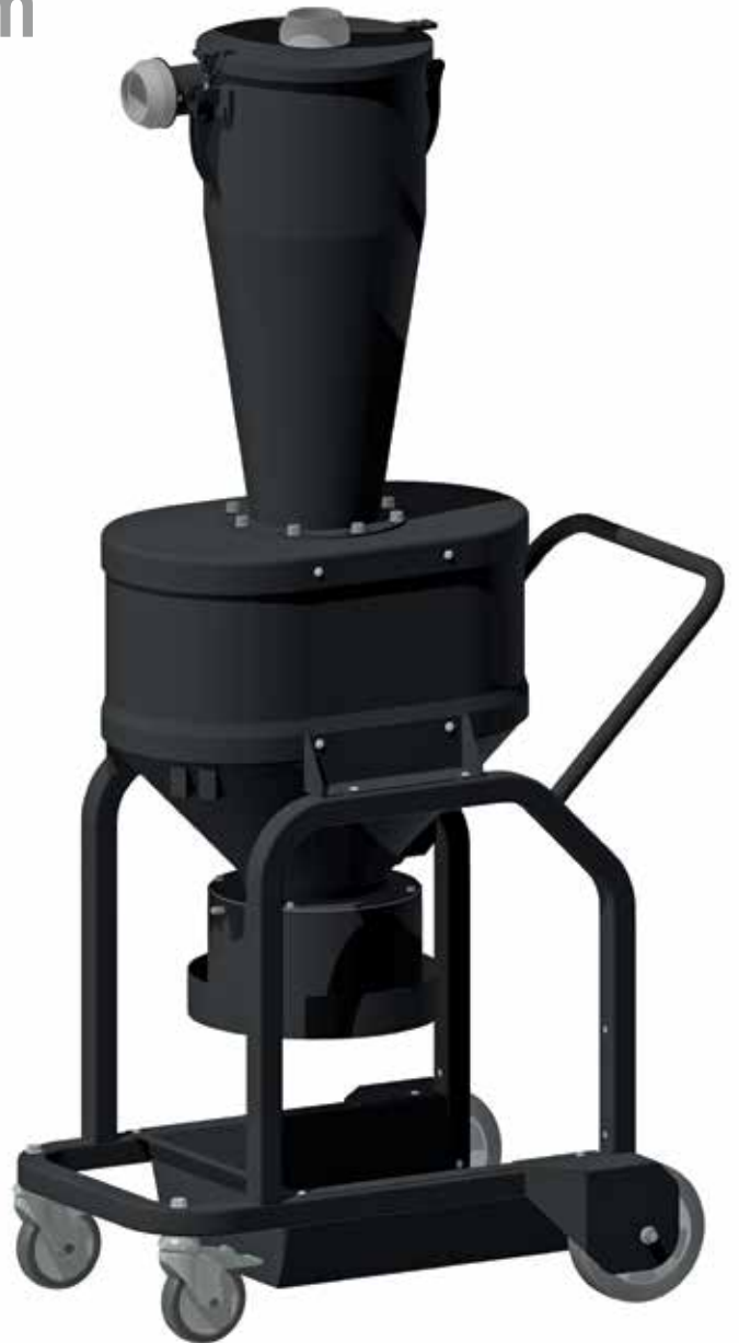
Zyklon mit Auslass für Longopac ®